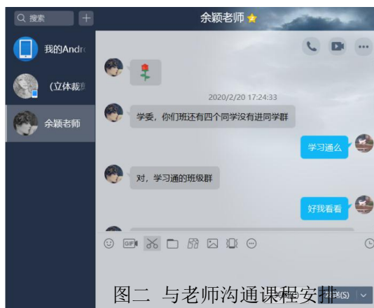
图二 与老师沟通课程安排